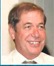
निको पिल संचालक