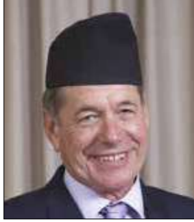
निको पिल संचालक (संस्थापक शेयरधनी एफएमओको तर्फबाट)